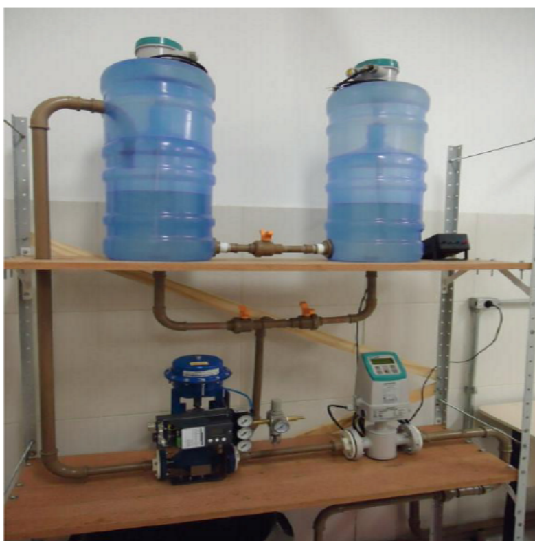
Figura 1. Sistema de Tanques usado no estudo de caso