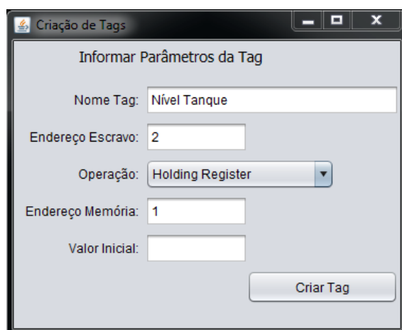
Figura 4. Configuração das tags do SCADA Pampa

tanque. Além do nome e de um endereço inicial, são também informados os parâmetros de configuração da tag , como o endereço do escravo, operação e endereço da variável Modbus . Os parâmetros passíveis de configuração estão detalhadamente descritos na documentação do ModBus [Modbus Organization 2012]. Esse processo foi repetido para a criação das demais tags de comunicação, que seriam utilizadas para a supervisão, cada uma com seus devidos parâmetros.